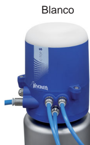
Indica la entrada y salida a los diferentes modos de funcionamiento