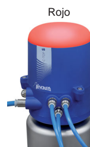
Indica fallo en la electrónica del dispositivo

Posibilidad de personalizar los colores de indicación visual para cada posición de la válvula mediante los interruptores DIP según la tabla siguiente: